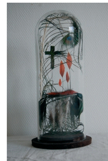
Séquence (2-3) , 2009, Barbara Puthomme