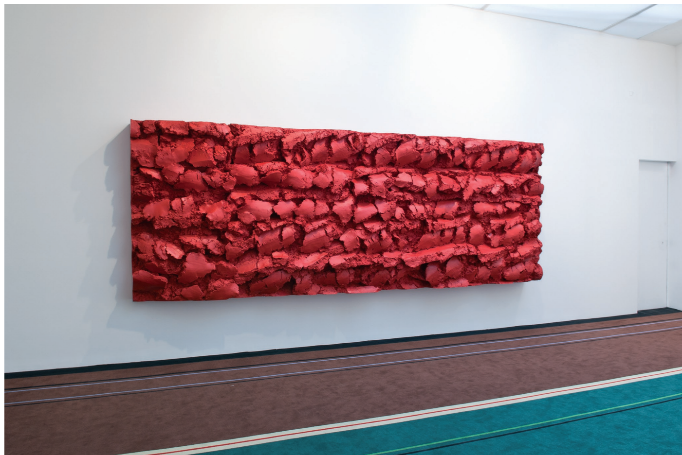
Sans titre , 2010, Didier Marcel. Résine polyester. Sommes-nous l'élégance . Musée d'art moderne de la Ville de Paris Collection particulière, Paris.