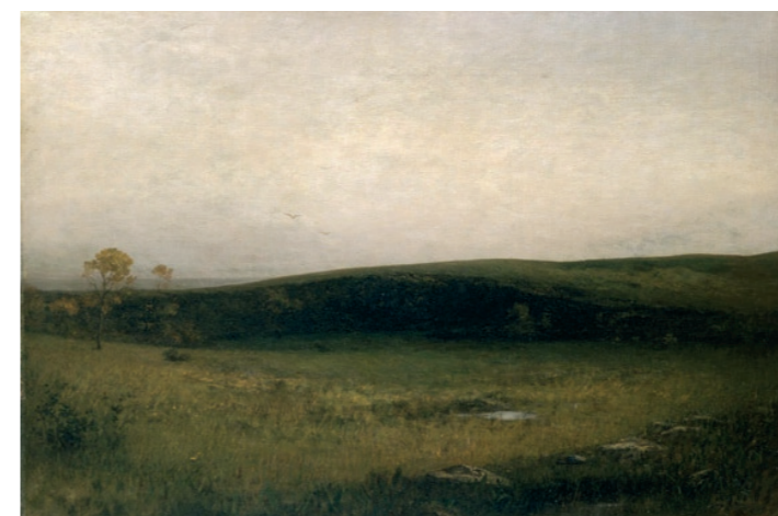
Coteau jurassien à la tombée de la nuit , achat de l'État au salon de 1881, Auguste Pointelin, dépôt du Fonds national d'art contemporain au Musée des beaux-arts et d'archéologie de Besançon

Pointelin, malgré son choix délibéré de peindre le Jura, souhaitera vivre à Paris. Là, il ne s'éloigne que rarement de son principal sujet : le «souvenir affectif» des paysages jurassiens, la traduction de son émotion face à une nature dépouillée de tout artifice et de toute anecdote. Il ne peint pas d'après nature mais d'après son sentiment. Jules de Gaultier, célèbre pour son analyse sur le bovarysme, compare l'impression provoquée par les oeuvres de Pointelin au sentiment de la nature même, à l'émotion intime que l'homme éprouve face au monde. Pointelin, dans ses paysages le plus souvent et volontairement inhabités, confronte le spectateur à sa propre solitude, en nous inscrivant en dehors du cadre, à sa propre place, celle de l'artiste. Pour ce «méditatif», l'image n'est rien : il va plus loin que l'image, plus loin que l'impression, plus loin que la vie terrestre. Il traduit, en d'insoupçonnables tonalités, le monde des âmes et l'immense univers des aspirations éthérées.