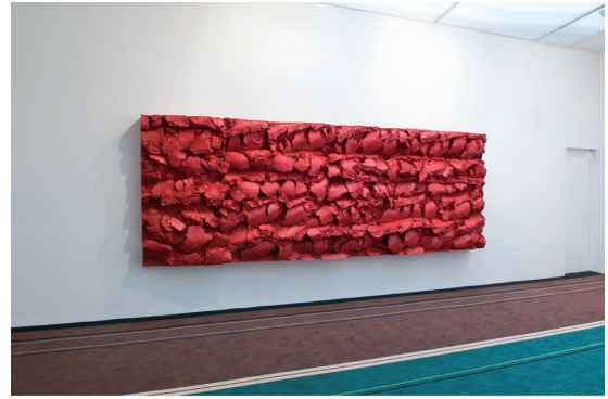
Sans titre (labour) , 2010, Didier Marcel, résine polyester. Sommes-nous l'élégance ? Musée d'art moderne de la Ville de Paris. Collection particulière, Paris

Extraits de paysages imaginaires ou composants d'images dans l'espace, les travaux de Didier Marcel représentent les détails d'une réalité, dont l'aliénation montre d'autant mieux que l'idée que l'on se fait de la nature est une mise en scène culturelle.