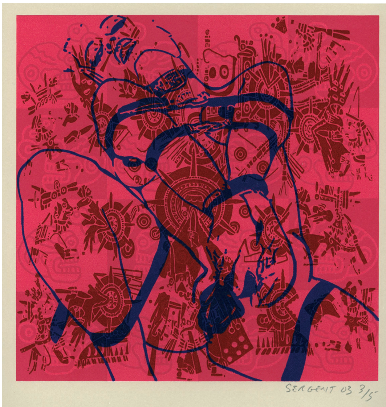
Bondage & Freedom, 2003, acrylique sérigraphiée sur papier Rives BFK, 25x25cm.

Exposition déconseillée aux moins de 18 ans.