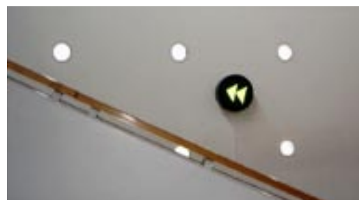
Hugo Schuwer-Boss au Collège Claude Girard en 2008