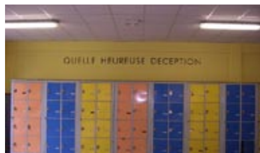
Jérôme Conscience au Collège Jaques Courtois en 2006