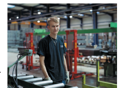
Clichés réalisés à la chambre par Nicolas Floc'h, 2010.

Les photographies de Nicolas Floc'h seront exposées à la Citadelle de Besançon, au Hangar aux Manoeuvres, avec les sculptures métalliques également réalisées.